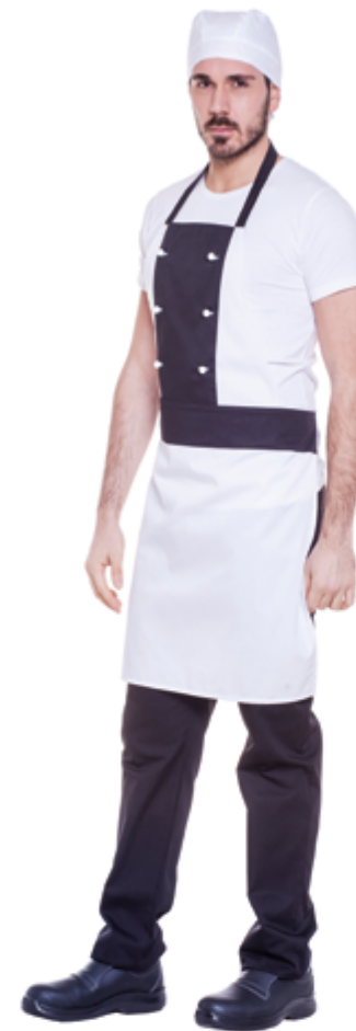
E001 Grembiule Pizzaiolo Unisex