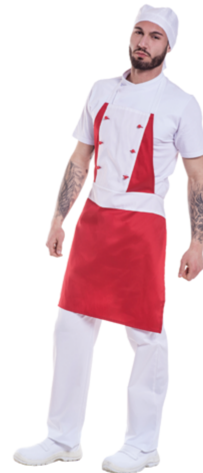
E002 Grembiule Pizzaiolo Unisex

Fascia in vita rinforzata e 2 lacci lunghi da cm 125 6 bottoni antipanico 65% poliestere - 35% Cotone da 170 gr. mq Non restringe e scolora al lavaggio Prodotto certificato OEKO-TEX Lavabile a 60 gradi Produzione Italia - Marca: Chef Italy